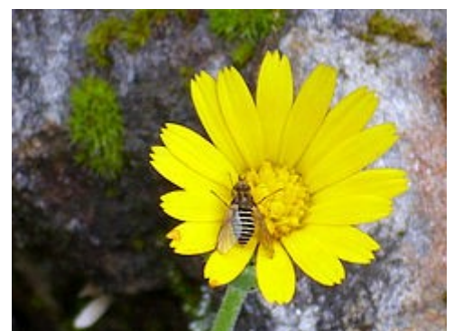
Detalle de la flor